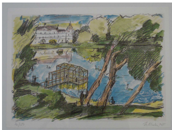
Lithographie „Musik auf dem Wasser“ 2

Die „Idylle“ konnte unterschiedlicher nicht hinterfragt werden wie z.B. durch Arbeiten von Anderle, Bulatov, Fleck, Gfader, Kabakov * oder Dieter Roth.