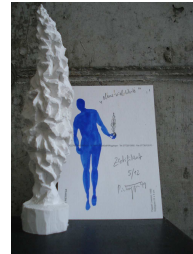
Edition "Ohne viel Worte"